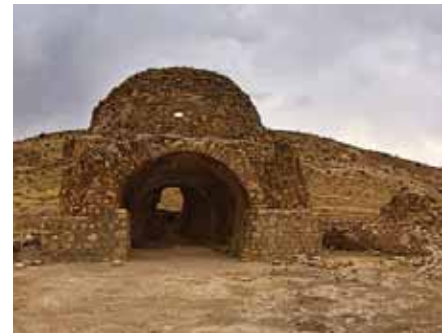
پل گاومیشان معماری دوره ساسانی

محمدی همین مسابقه درس پژوهی که گفتیم، دربردارنده چنین نکته‌ای بود. در آن مسابقه محورها مشخص شده بود اما امسال محورها را خیلی آزادانه‌تر توانستیم تدریس کنیم؛ فقط یک مقدار وقت کم بود. چون محور ما خلاقانه بود بیشتر از چیزهایی استفاده کردم که دانش‌آموزان تا کنون به کار نبرده بودند؛ مثلاً بافت با چسب چوب بود که اصلاً دانش‌آموزان کار نکرده بودند. بافت‌هایی بودند که همه را از اینترنت گرفته بودم و برای آن‌ها بردم. همه جدید بودند و بچه‌ها خیلی علاقه‌مند شدند و با ما همکاری می‌کردند؛ چون هر بار که تمرین می‌کردیم