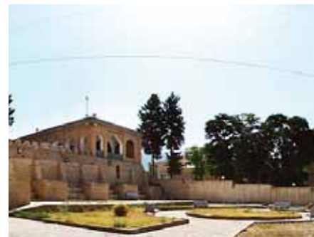
کاخ فلاحتی ایلام معماری دوره قاجار

منصوریان: آفرینش هنری نیاز به دوری از دغدغه دارد و کارگاه هنر محل انجام دادن فعالیت‌هایی است که در کلاس‌های مرسوم امکان آن وجود ندارد