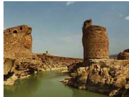
پل گاومیشان معماری دوره ساسانی در مسیر رود سمیره

برومندان: دانش‌آموزی که هنوز رنگ سرد و گرم تعادل، ریتم، نظم و ترکیب را یاد نگرفته، چطور می‌تواند تصویرسازی را خیلی ساده و خیلی خلاقانه انجام دهد؟